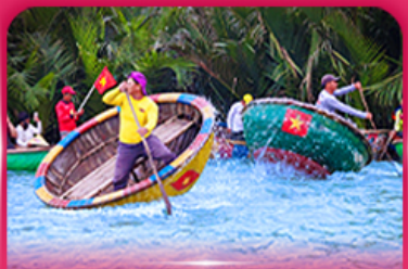
ล่องเรือกระดัง หมู่บ้านกิมทาน