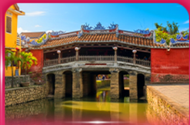
สะพานญี่ปุ่นโบราณ ฮอยอัน