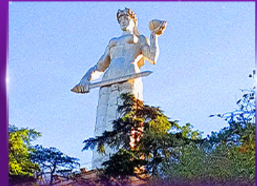
นั่งกระเช้าชมวิว บิอนนาทิการา