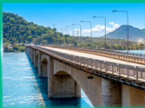
สะพานมิตรภาพลาว - สิบูน