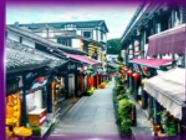
หมู่บ้านโบราณฉิงซีโหว่