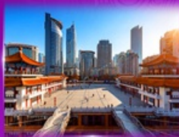
เขคฉิน ตึกโค่วซิงโหล