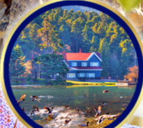
ทะเลสาบโกลจุก

อิสตันบูล • สุหรัสน้ำเงิน (บลูมอสก์) • สุหรัชนต์โซเฟีย • อีปโปโดรม • ตลาดสีปรอท ม้าไม้จำลอง ชานิคคาเล่ • เมืองโบราณเฮียราโพลิส • ปราสาทปูยีผ้าย • คาราวานชาธา พิพิธภัณฑน์มฟลานา • หุบเขานกพิราบ • ชมวิวเกอเรเน่ • นครใต้ดินชาดิก • หุบเขาอูชีซาร์ ทะเลสาบเกสิอ • พิพิธภัณฑน์อตาเดิร์ก • ทะเลสาบโกลจุก • หอคอยกาอาตา • จตุรัสทักซิม