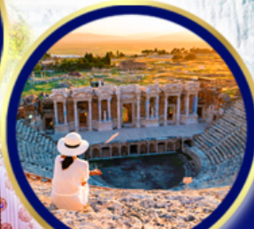
นครเฮียราโพลิส