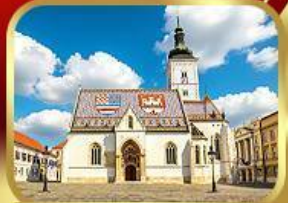
โบสถ์เซนต์มาร์ก ซาเกรบ