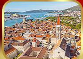
มหาวิหารเซนต์โลว์เรนซ์