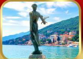
ราชินีแห่งอาเดรียติก โอฟาเทีย