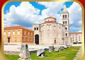
โบสถ์เซนต์โธมัส ซาเกรบ