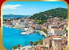
ชมย่านเมืองเก่าสปลิก

14-21 พ.ค. ปรับลดจาก 75,555 18 ที่สุดท้าย 73,333.-