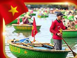
เรือกระด้ง หมู่บ้านกัมทาน