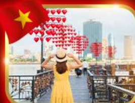
เช็กอินสะพานแห่งความรัก