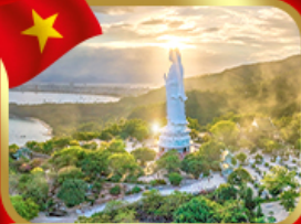
ชมพระกวนอิม วัดหลินอิ่ง