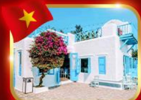
คาเฟ่สุดชิค ซานทรา มารีน่า