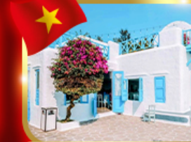
คาเฟ่สุดชิค ซานทรา มารีน่า