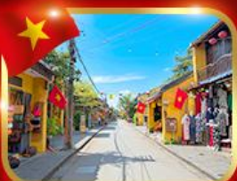
เมืองมรดกโลก ฮอยอัน