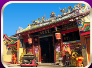
ศาลเจ้าแม่ลิ้มกอเหนี่ยว

ที่เที่ยวเพิ่มขึ้น และ ช่วยฟื้นฟูเศรษฐกิจขาดใหญ่