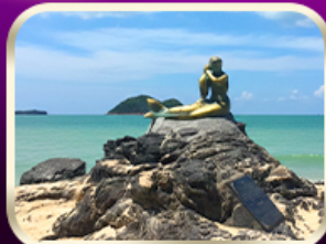
เที่ยวหาดสมิหลา สงขลา