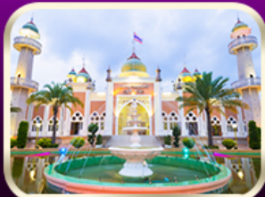
ชมมัสยิดกลางปัตตานี