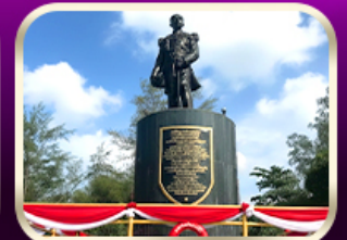
อนุสาวรีย์กรมหลวงชุมพรฯ