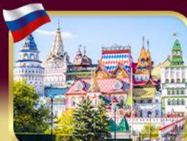
อิสมายลอฟสกีมาร์เก็ต