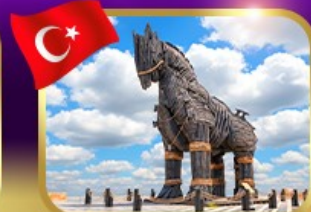
ม้าไม้เมืองกรอย ซานักคาล์