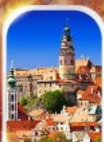
CESKY KRUMLOV CZECH