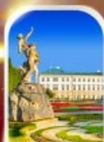
MIRABELL PALACE AUSTRIA