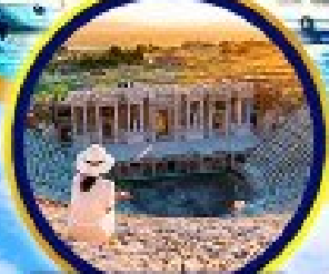
นครเชินราฟอส