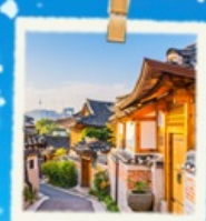
หมู่บ้านนูกซอน