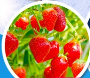
ไรสตอร์จเบอร์รี่