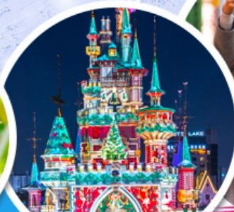
สวนสนุกคิวดเต้