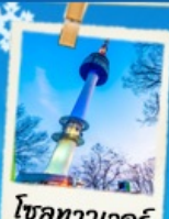
โซลทาวเวอร์