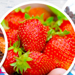
ไร่สตอร์เบอร์รี่