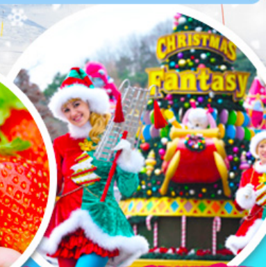
เอเวอร์แลนด์