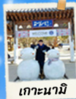
เกาะนามิ