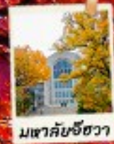
เมฆาคับขี้ควา