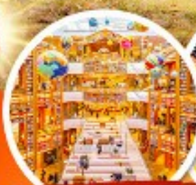
ห้องสมุดสตาร์ฟิสต์