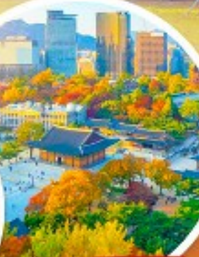
พระราชวังเคียงอกซุกุง