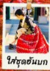
ใส่ชุดฮันบก