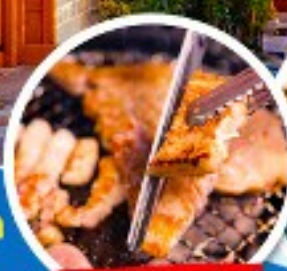
หมู่บ้านเกาหลี