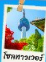
โซลทาวเวอร์