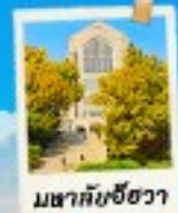
มหาศาลซ็องวา