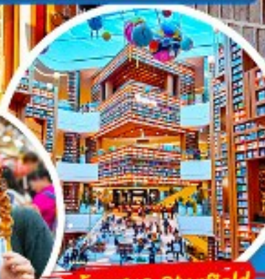
ห้องสมุด Starfield