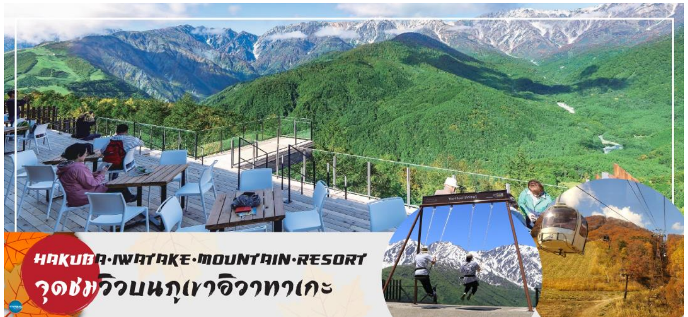
HAKUBA IWATAKE MOUNTAIN RESORT จุดชมวิวนภูเขอิวาทาเกะ

วันที่สี่ เมืองมัตสึโมโตะ – เมืองนากาโนะ – ฮาคูบะ – HAKUBA IWATAKE MOUNTAIN RESORT (คอนโดล่า ลิฟท์) – ไร่อาซาฮิไดโอะ – เมืองยามานาชิ – อุโมงค์ไบเมเบิล (ขึ้นอยู่กับฤดูกาล) – หมู่บ้านโอชิโนะสั๊กไก – ออนเซ็น + ชาบูยักษ์