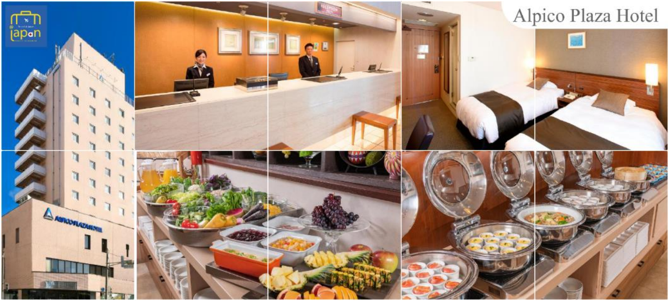
Alpico Plaza Hotel

พักที่ ALPICO PLAZA HOTEL หรือเทียบเท่าระดับเดียวกัน