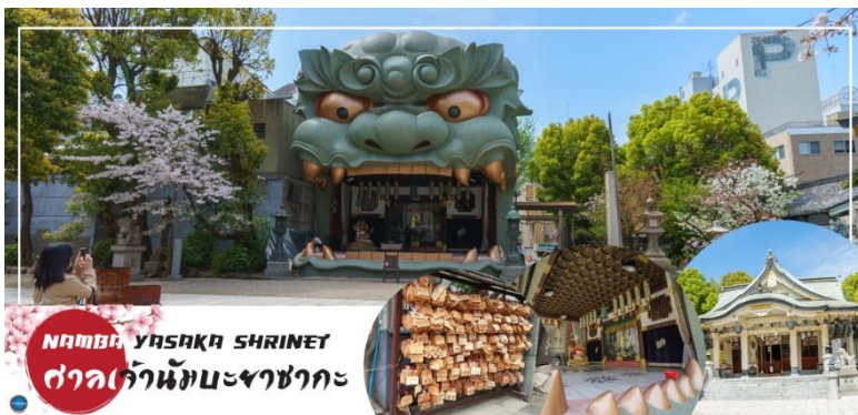
NAMBA YASAKA SHRINE ศาลเจ้านัมมะยาซากะ

นำทุกท่านเช็คอินจุดถ่ายรูปที่ ศาลเจ้านัมมะยาซากะ (Namba Yasaka Shrine) ในย่านนัมมะยะของเมืองโอซาก้า ไฮไลท์ของศาลเจ้าแห่งนี้ คือรูปปั้นหน้าสิงโตอ้าปากขนาดใหญ่ ที่เชื่อกันว่า สามารถกลืนกินปีศาจร้ายหรือ สิ่งไม่ดีทั้งหลาย ให้หายไป และนำพามาซึ่งความโชคดีให้แก่ผู้คน ปัจจุบันนักเรียน นักศึกษา และผู้ประกอบการธุรกิจนั้น นิยมมาขอพรให้ประสบความสำเร็จกันที่นี่ ด้วยความสูง 17 เมตร ความกว้าง 11 เมตร และความลึก 7 เมตร อีสระให้ทุกท่านสักการะ และเก็บภาพที่ ศาลเจ้านัมมะ ยะซากะ