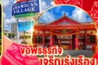
พิพิธภัณฑ์เจริญรุ่งเรือง!