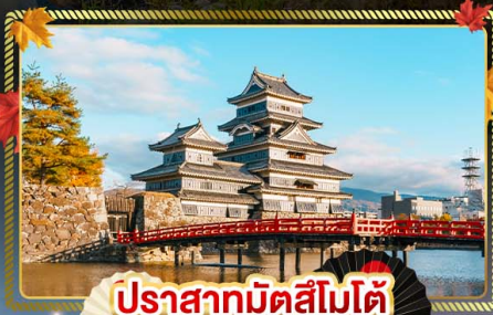
ปราสาทมิตสึโมโตะ