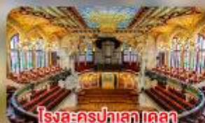
โรงละครปาลาเดอเดลา มูสิคก้า คาตาลานา