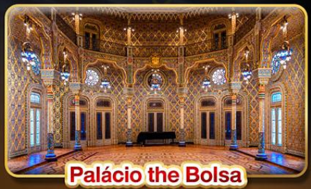
Palácio the Bolsa

📅 เดินทาง : 9 - 18 ต.ค. | 30 พ.ย. - 9 ธ.ค. 69