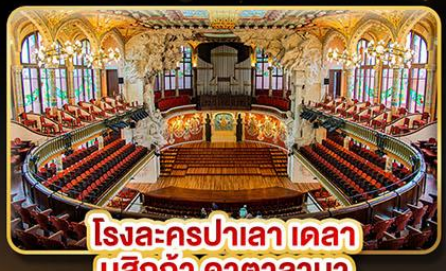
โรงละครปาลาเลา เดลา มูสิกา คาทาลานา