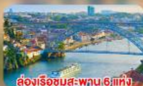
ส่องเรือชมสะพาน 6 แห่ง ในคูเมืองปอร์โต