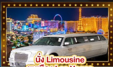
นั่ง Limousine ชมเมือง Las Vegas