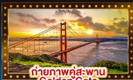
ถ่ายภาพคู่สะพาน Golden Gate