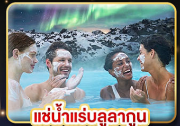
♨️ แช่น้ำแร่สุขภาพ