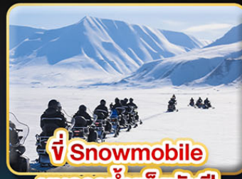
🏍️ ขี่ Snowmobile บนธารน้ำแข็งพันปี