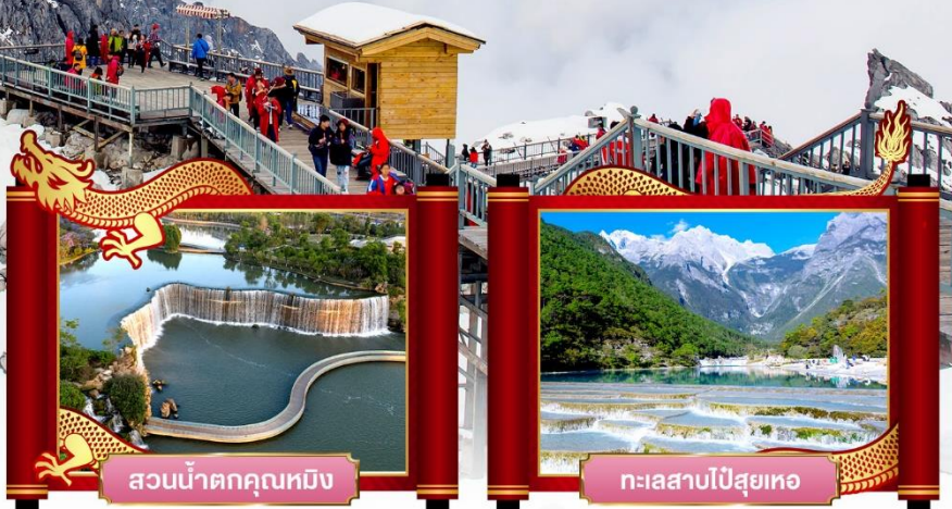
สวนน้ำตกคุนหมิง

✓ พิเศษ! โชว์จางอวิโหม่ว "ความประทับใจลี่เจียง"