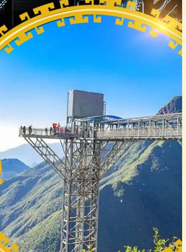
สะพานแกว้มิงกรเมซ