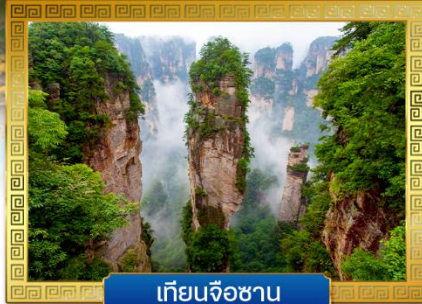
เทียนจื่อซาน

✓ นั่งกระเช้าขึ้นสู่ ... ภูเขาประตูลูกสวรรค์