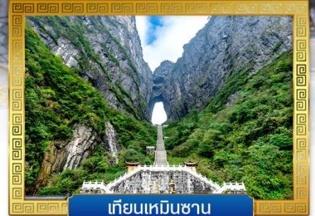
เทียนเหมินซาน