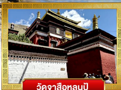
วัดจาซือหลุนปู้