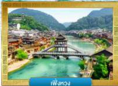
เฟิ่งหวง