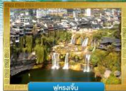
ฟูรงเจิน