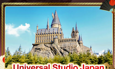
Universal Studio Japan (อิสระท่องเที่ยว)