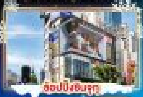
ฮอนปิงชินจูกุ