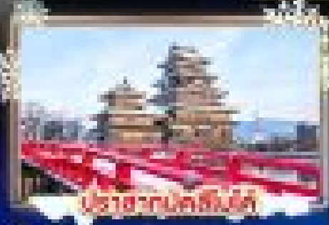
ปราสาทนาคสึโนะ