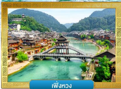
เฟิ่งหวง