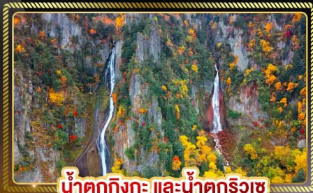
น้ำตกทิงกะ และน้ำตกริวเซ