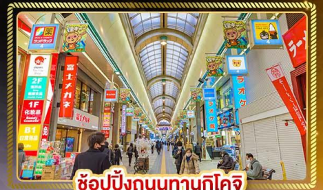
ช้อปปิ้งถนนทานุกุโคจิ