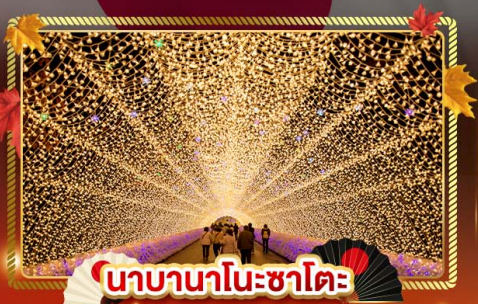
นาคานาโนะซาโตะ