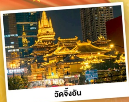
วัดจิ่งอัน