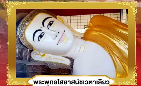
พระพุทธรูปไสยาสน์ชเวตาเลียว