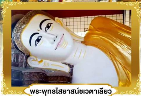
พระพุทธรูปไสยาสน์ชเวตาเลียว