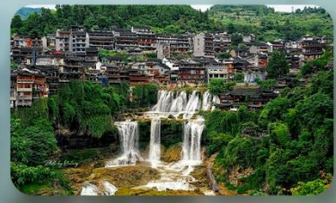
หมู่บ้านฟุหลงเจิ้น