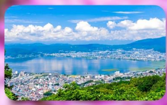
ทะเลสาบสุวะ