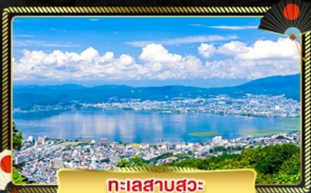
ทะเลสาบสุวะ