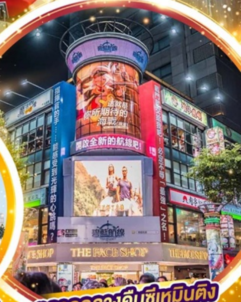
ตลาดกลางคืนซีเหมินติง

หมู่บ้านปัสจางซีโกว หมู่บ้านสไตล์ญี่ปุ่น ล่องเรือทะเลสาบสุริยันจันทรา, หมู่บ้านโบราณจิวเฟิ่น หมู่บ้านชาวประมงหลากสีเจิ้งปิ่น อิสระ 1 วันเต็ม