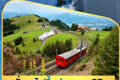
นั่งรถไฟขึ้นสู่ยอดเขาโรติก