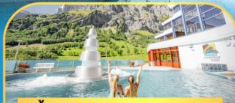
แช่น้ำแร่ร้อนผ่อนคลายลวยคอร์บิต