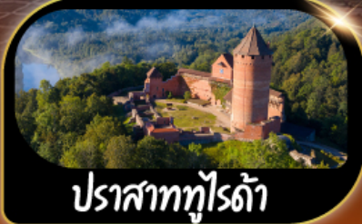
ปราสาททุไรดำ