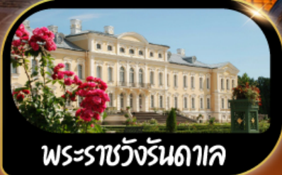
พระราชวังรันดาค