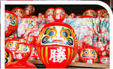
วัดแห่งชัยชนะ-วัดคัตสึโอจิ(วัดคารุมะ)