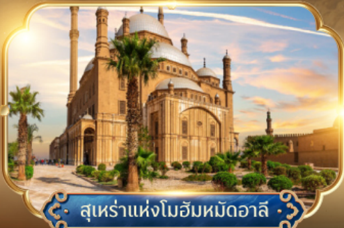
สุเหร่าแห่งโมอิมหมัดอาลี