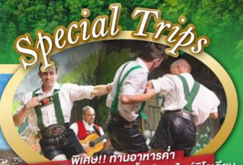
พิเศษ!! ทานอาหารค่ำ พร้อมชมการแสดงดนตรีพื้นเมืองสไตล์ทิโรเลียน และเยือนเมืองอูเทรคต์ สีสันใหม่เนเธอร์แลนด์