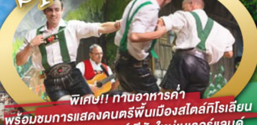
พิเศษ!! ทานอาหารค่ำ พร้อมชมการแสดงดนตรีพื้นเมืองสไตส์ทีโรเลียน และเยือนเมืองอูเทรคต์ สีสันใหม่เบียร์แลนด์

ไฮไลท์ในโปรแกรม • เยือนเมืองแห่งแคว้นบาวาเรีย และ ทีโรล • สุกสนานเหมืองเกลือเบียร์เทสกาเดิน • เข้าชมปราสาทนอยชวานสไตน์ • เดินเล่นจัตุรัสโรเมอร์ ซ็อบบิง Zeil Street • ถ่ายรูปมุมสวยของหมู่บ้านอัลสติก • ซิลลา ไปในเมืองซาลสบูร์ก บ้านเกิดโมสาร์ท • ล่องเรือหมู่บ้านทีธูร์น และ ล่องเรือชมนครอัมสเตอร์ดัม • ซ็อบบิงจุ้ย่านดิมสแควร์และเดินเล่นย่านโคมแดง 25 ก.ย. - 04 ต.ค. 69 09-18, 16-25 ต.ค. 69 22-31 ต.ค. 69 / 06-15 พ.ย. 69 29 ธ.ค. 69 - 07 ม.ค. 70 * ปีใหม่ *