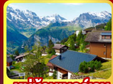
หมู่บ้านเมอร์ริเซน