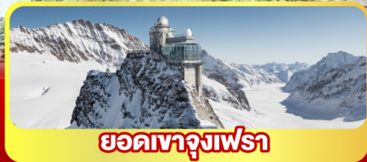
ยอดเทาจุงเฟรา