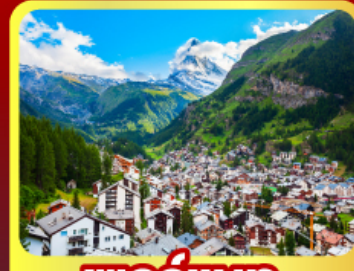
เชอร์แมนท์