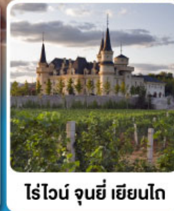
ไร่ไวน์ จุนยี่ เยียนโก