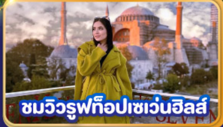
ชมวิวยูฟิโอปเซเวนฮิลส์