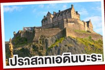
ปราสาทเอдинบะระ