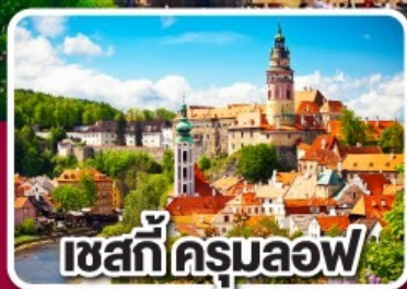
เซกที่ครุมลอฟ

ฮังการี สโลวาเกีย ออสเตรีย เชก 7 วัน 4 คืน