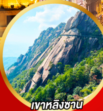
เวาหลิงซาน