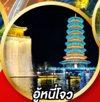
อู่หนี่โจว