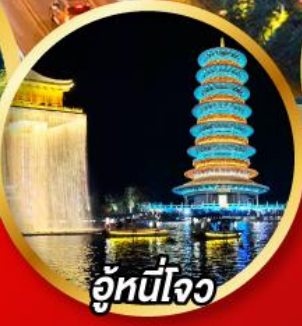
อุ๋หนี่โจว