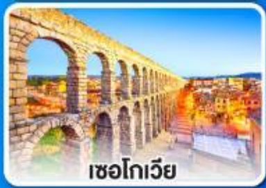
เซโกเวีย