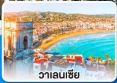
วาเลนเซีย